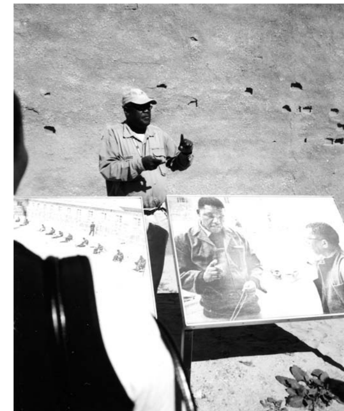
Eks-fange fortæller om sin tid som indsat på Robben Island – En ung Nelson Mandela på billedet.

mulighed for at høre om andres rejseidéer og erfaring. Vi var en tur på Robben Island i går.