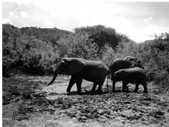
Safari, Serengeti. Lake Manyara National Park

Siden sidst har vi været på safari. Vi kørte gennem Serengeti, Ngorogoro og Lake Manyara national parker i løbet af fire dage. Vi kørte en distance af 700 km i vekslende terræn – savanne, bush, tørre flade sletter, bjerge, søer og frodig skov. Og vi har set dem alle – dyrene. Især de mest berømte "The big five": Elefanten, løven, leoparden, næsehornet og bøflen.