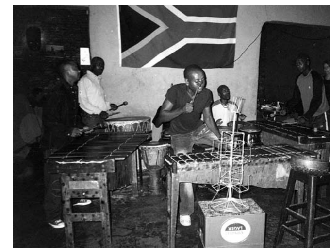
Koncert, Restaurant Mamafrika, Cape Town.

En ø, hvor Nelson Mandela sad i fængsel i 18 år. Vi har haft hans selvbiografi med og læst om stedet, så det var prikken over i'et at få set det i virkeligheden.