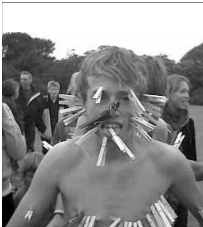
Billeder fra Farup Byfest 2005