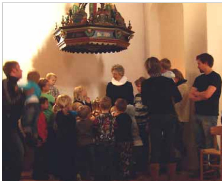
Fra småbørnsgudstjenesten d. 22.nov.