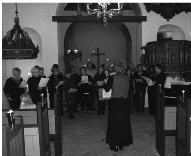
Stemning fra adventsaftensang i kirken d. 14. dec.