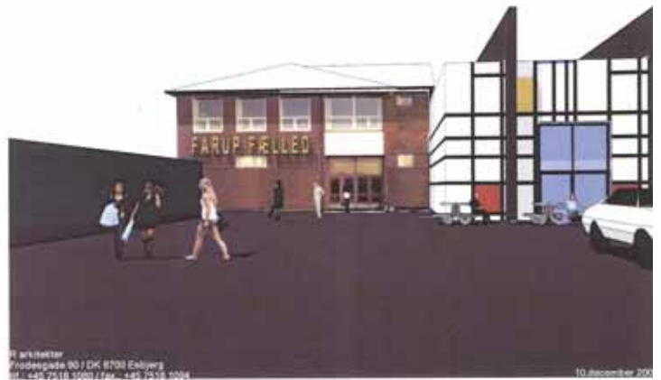
Farup Landsby Fælled

Vi holder altså fast i det tidligere offentliggjorte budget for egenfinansiering som ser sådan ud.