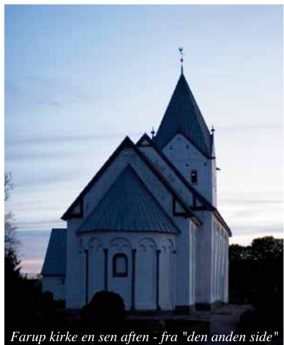
Farup kirke en sen aften - fra "den anden side"

Gennem kor – og fællessang vil vi komme omkring den alsidighed, der findes i Jens Rosendals tekster.