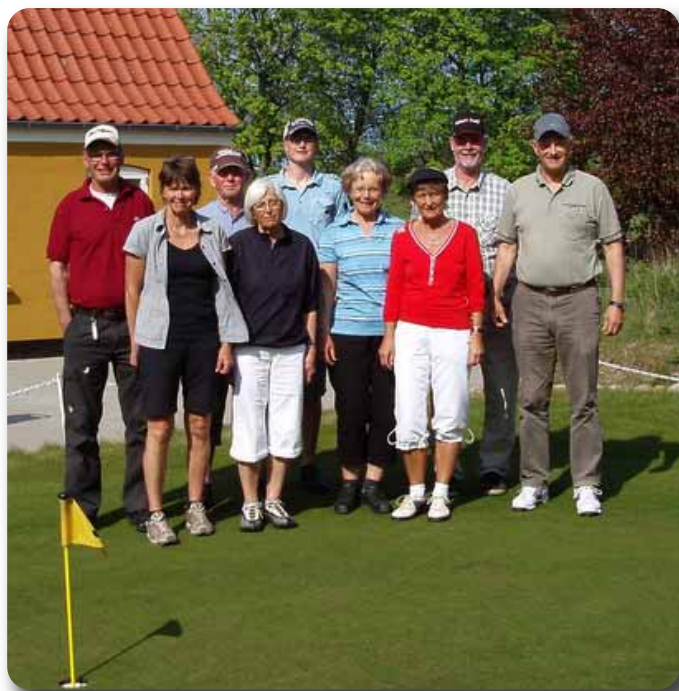
Farup holdet klar til match.

Over smørrebrødet og kaffen efter matchen var der enighed om at gøre det til en tradition, så de nye Farup mestre fik opgaven med at arrangere matchen næste år. Så fredagen før konfirmationen i Farup 2012 er der igen golf, hvor alle golfspillere med tilknytning til Farup er velkommen.