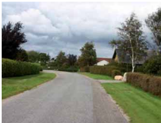
Farup er en haveby med grønne rabatter langs vejene.

Farup ligger 5 km fra Ribes bymidte, hvilket har været afgørende for begrænsningen af byens servicefunktioner.