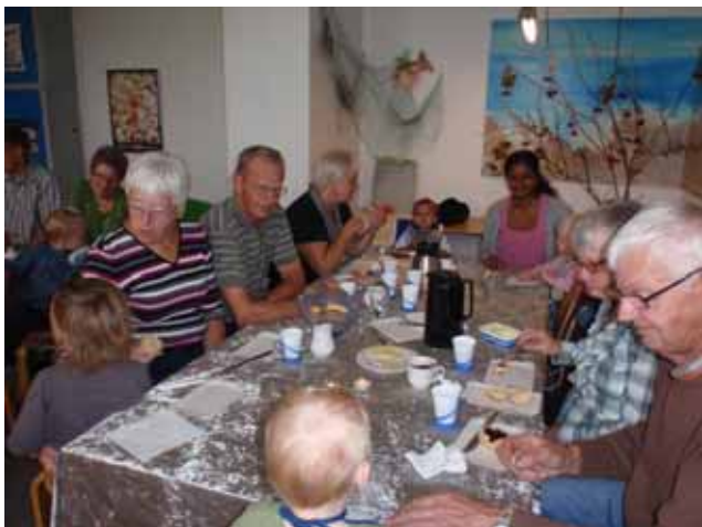
H ø s t f e s t i