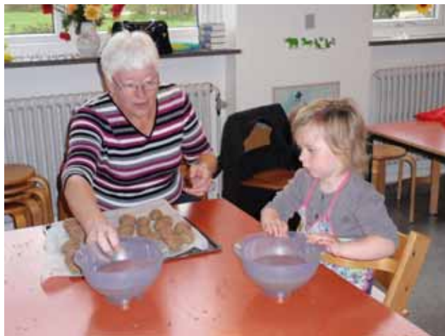
d a g p l e j e n