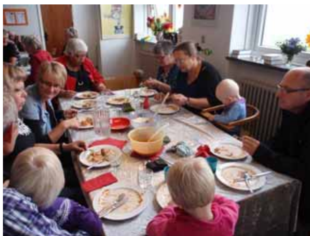
V a r d e l e g e b o r g