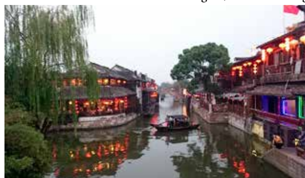
Shanghai, Asiens Venedig

Shanghais vanvittig flotte skyline. Det er også på denne gade, der er nogle af de mest eksklusive klubber, bl.a. Bar Rouge som er verdenskendt for musik, drinks og udsigt, hvilket selvfølgelig var en af vores mange stop rundt i bylivet i Shanghai, og jeg må indrømme, at hver en krone for de drinks var det værd! Generelt var der vild mange indtryk at gå rundt i Shanghai. Calvin Harris spillede på en klub, indgangen til en anden klub havde en 30 meter lang tunnel med hajer. Da jeg måske har givet indtrykket af kun at have været i Shanghai for bylivet, må jeg nok også hellere nævne lidt andet. Vi valgte at tage en togtur lidt udenfor Shanghai, hvor vi fandt Kinas svar på Venedig. Byen var mindre og på størrelse med Ribe og havde en masse små kringledede stier, der fulgte vandet, alt i mens der i hver bygning var lokale mad-, hostels- eller souvenirbutikker. Desværre var meget af den lokale mad stinketofu, hvilket er en slags tofu, der skulle smage godt, det gør det ikke!, men har en forfærdelig lugt og smag af overbrændt råddent mad. Gaderne i den historiske gamle by havde en god og charmerende udsigt men en knap så god aroma. Alt i alt en hyggelig dag og en sjov ferie i Shanghai, hvor jeg fik snakket med andre SDC-studerende, jeg ikke endnu havde snakket med før, primært da vi alle kom fra forskellige programmer af SDC.