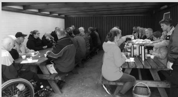
Tak til alle, der var med til at gøre Sognestivandringen omkring Kammerslusen til en spændende og hyggelig aften.