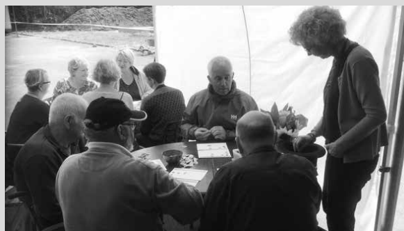
Glimt fra kirkeboden ved landsbyfesten. Her er det spillebuden.