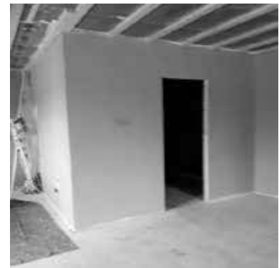
Vores nye brandsikre rum – en del af det lille mødelokale i aktivitetshuset