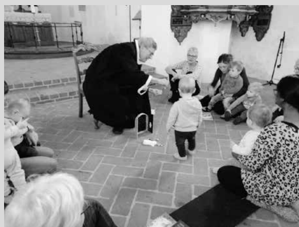
Dagpleje-jul i kirken