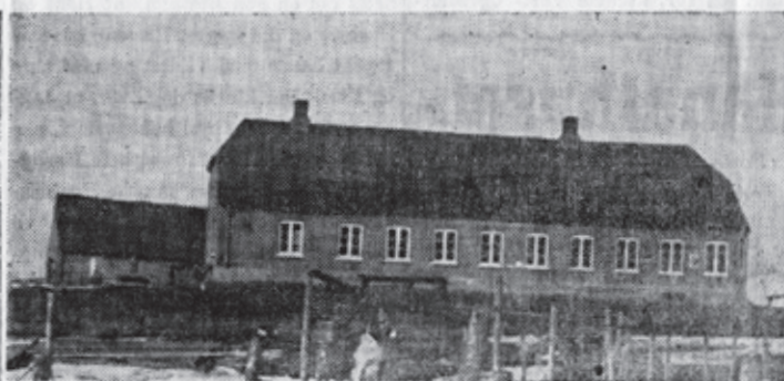
Kanalhuset, som det ser ud nu.

get „ej blot til Lyst“. I den Tid, hvor Ribe endnu havde en ikke helt ubetydelig Smaaskibsfart, gjorde Kanalhuset Tjeneste som Karantænestation. Det var Koleræen, man frygtede, og det gule Karantæneflag vajede i adskillige Aar fra Kanalhusets Flagstang. Ogsaa paa anden Vis var Kanalhuset til Nytte.