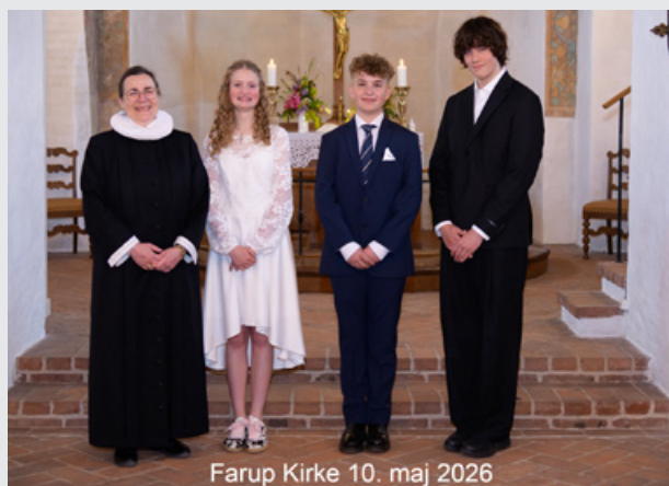
Farup Kirke 10. maj 2026